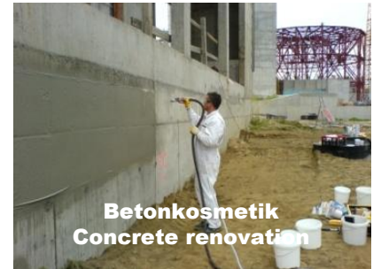
Betonkosmetik Concrete renovation