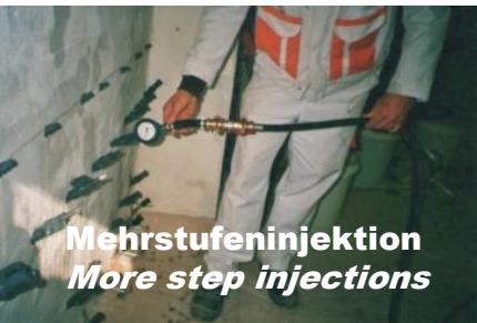
Mehrstufeninjektion More step injections