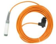
Fernsteuernkabel Remote control 15 / 25 mtr