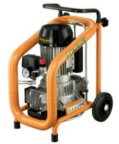
Kompressor C330/3 230 V - ölfrei