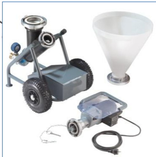
Zerlegbar in 3 Teile Detachable into 3 parts