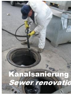
Kanalsanierung Sewer renovatio

Spritzlanze im Alu-Koffer mit 5 Düsen und Werkzeug Spray lance in alu box with 5 nozzles and tools