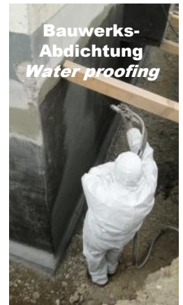
Bauwerks- Abdichtung Water proofing