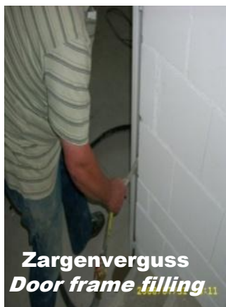
Zargenverguss Door frame filling