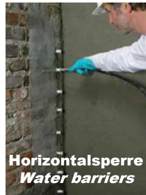
Horizontalsperre Water barriers