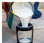
1. FlexLiner™ Sack mit Material befüllen