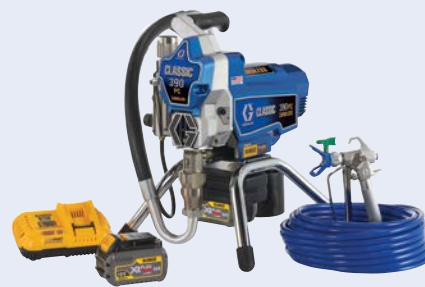
Classic 390 PC Cordless: das zuverlässige Arbeitstier

Die leistungsstärkste Serie kabelloser Spritzgeräte, die jemals entwickelt wurde, bietet die nötige Unabhängigkeit, um Aufträge schneller zu erledigen