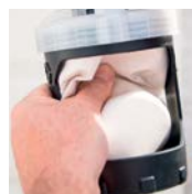
2. Verbleibende Luft herausdrücken