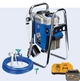
GX21 Cordless: Der Überflieger